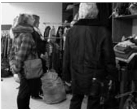
◆ Een bezoekje aan de winkel van de Stichting mocht niet ontbreken.

Zo kwam een einde aan een intensieve, maar vruchtbare middag en keerden de dames volstaan, met nog een visje op zak, huiswaarts.